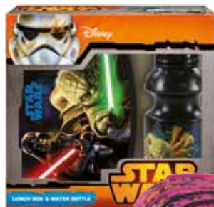
ZESTAW ŚNIADANIÓWKA + BIDON (ZSBSW10)