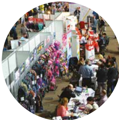
Targi Hurtowni MONIKA z Bydgoszczy

Za nami kolejny gorący sezon targów branży szkolnej i biurowej. Od kwietnia do połowy czerwca odbyło się ponad 50 imprez w całej Polsce. Jak podkreślają organizatorzy, większość z nich przyciągnęła w tym roku rekordową liczbę dostawców. DERFORM zaprezentował swoją ofertę podczas większości zorganizowanych przez hurtownie targów. Nasze produkty tekstylne przeznaczone na bieżący sezon szkolny prezentowane były w odświeżonej formule. Nasi klienci mogli się również zapoznać z nowym narzędziem komunika-