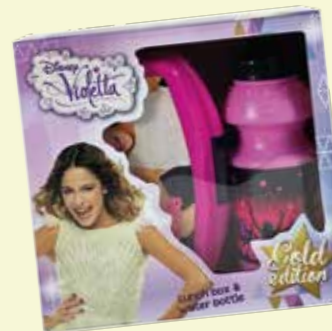
ZESTAW ŚNIADANIÓWKA + BIDON (ZSBV118)