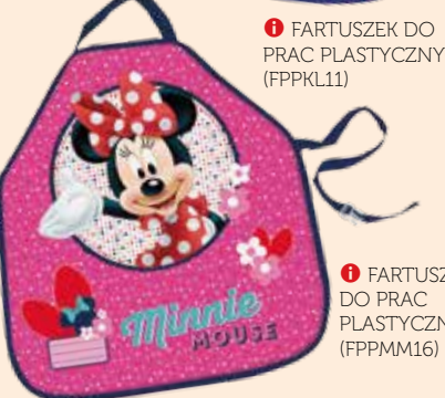
1 FARTUSZEK DO PRAC PLASTYCZNYCH (FPPMM16)