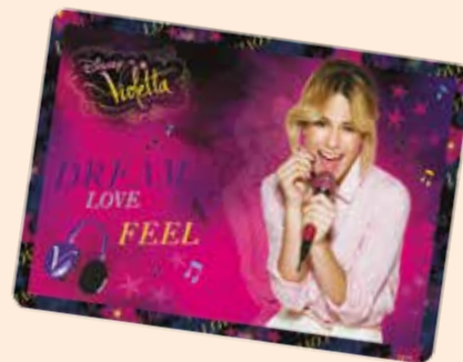
1 PODKŁAD OKLEJANY (PLAVI-1)