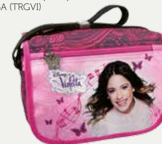
TOREBKA NA RAMIĘ (TRCVI13)