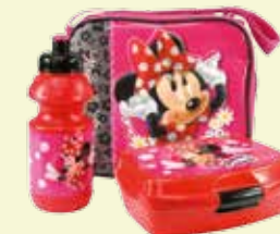
ZESTAW ŚNIADANIÓWKA + BIDON W TOREBCE (ZSBTMM11)