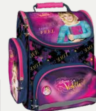
TORNISTER ERGONOMICZNY (TEMV121)