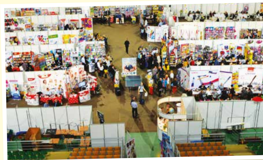
X edycja kujawsko-pomorskich targów papierniczych. Hala „Łuczniczka” w Bydgoszczy, 15–16 kwietnia 2015 r.

M. Skonieczny: Działamy na terenie trzech województw: pomorskiego, kujawsko-pomorskiego i warmińsko-mazurskiego. Mamy flotę samochodów dostawczych, więc dostawa towaru w naj-