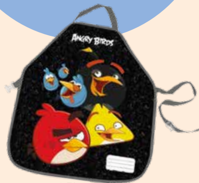
1 FARTUSZEK DO PRAC PLASTYCZNYCH (FPPAB10)

...A RODZICE PORZĄDEK – POZWÓLMY JEDNAK MALUCHOM POZNAWAĆ ŚWIAT W BEZTROSKI I BRUDNY SPOSÓB. ZWŁASZCZA PODCZAS DOMOWYCH ZABAW Z FARBAMI CZY WSPÓLNEGO GOTOWANIA WARTO WYKORZYSTAĆ FARTUSZKI, KTÓRE OCHRONIĄ UBRANKA DZIECI.