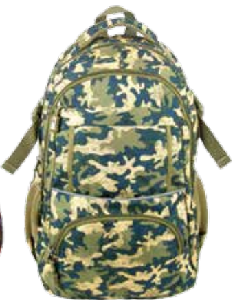
PLECAK MŁODZIEŻOWY (PLM18I18)