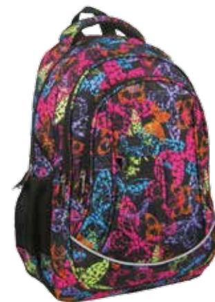
PLECAK MŁODZIEŻOWY (PLM16E14)