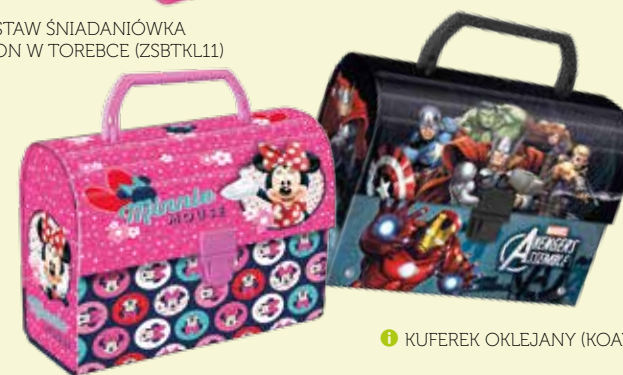
KUFEREK OKLEJANY (KOAV)