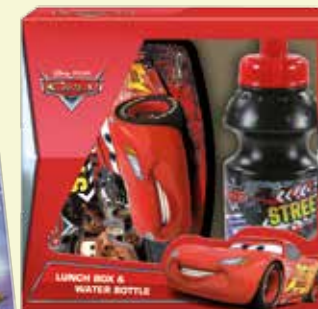
ZESTAW ŚNIADANIÓWKA + BIDON (ZSBKA36)