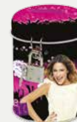
SKARBONKA Z KLÓDKĄ (SKVI18)