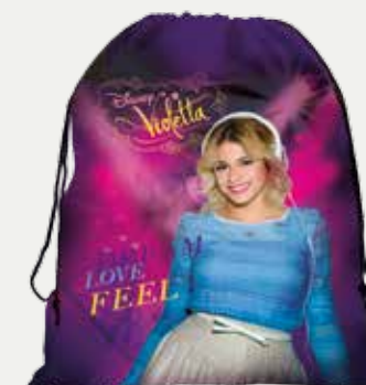
WOREK NA OBUWIE (WOVI21)