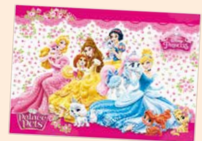
1 PODKŁAD OKLEJANY (POKS)

BEZPIECZNE BLATY I STOŁY POWIERZCHNIE BLATÓW, BIUREK CZY STOŁIKÓW MOŻNA ZABEZPIECZYĆ DEDYKOWANYMI MATAMI LUB PODKŁADKAMI Z ULUBIONYMI BOHATERAMI Z BAJEK I FILMÓW.