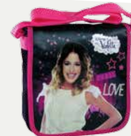
TOREBKA NA RAMIĘ (TRAVI18)

Serial wyemitowano, gdy miałam 14 lat. Wtedy jeszcze nie znałam miłości ani prawdziwej przyjaźni. Serial opowiada o dziewczynie, która jest zagubiona i szuka swego miejsca w świecie – ze mną było podobnie. Dlatego tak ujęła mnie ta historia. Moją ulubioną postacią jest jednak Lodovica Comello – to dla mnie wzór do naśladowania. Mimo że nie gra głównej roli, a fani zawsze bardziej lubili Martinę, to ona szybciej zaczęła się rozwijać. Poszła swoją drogą i pokonała wiele przeszkód, by zdobyć sympatię widzów. Dzisiaj ma na koncie dwa albumy i własną trasę koncertową!