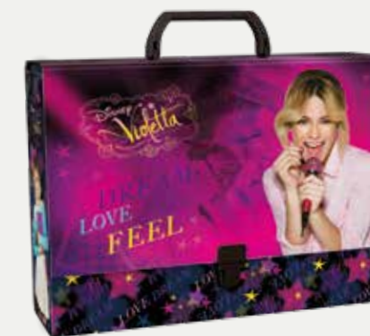
TECZKA Z RĄCZKĄ GRUBA (TRGVI)