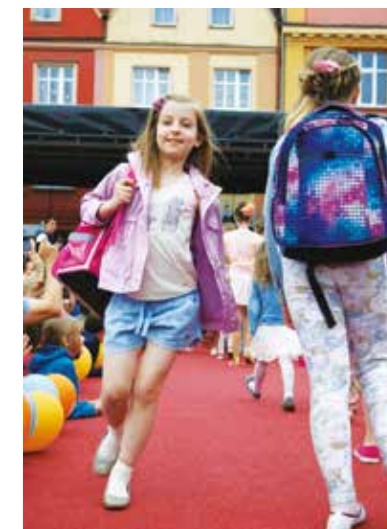
Plecaki i torebki DERFORM prezentowane były podczas pokazu mody dziecięcej w Dniu Dziecka zorganizowanym przez sklep Restler Junior w Chojnicach

szczególnie ważny również dla wszystkich firm działających w sektorze szeroko pojmowanych produktów dla dzieci. Największym powodzeniem cieszą się wtedy oczywiście zabawki, choć artykuły upominkowe i szkolne również pozostają w sferze zainteresowania zarówno rodziców, jak i samych dzieci. W kilku sklepach detalicznych w Polsce firma DERFORM zorganizowała w tym roku eventy z okazji Dnia Dziecka. Dzieci odwiedzające sklepy mogły w tym czasie skorzystać z różnego rodzaju zabaw i animacji oraz wziąć udział w konkursach, w których nagrodami były m.in. plecaki DERFORM. Zainteresowanie najmłodszych było ogromne, dlatego tego typu działania na pewno na stałe wejdą do marketingowego kalendarza DERFORM.