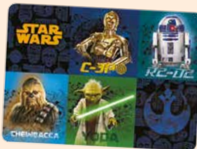
1 PODKŁAD OKLEJANY (PLASW)