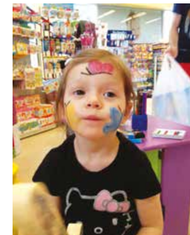
Podczas Dnia Dziecka w sklepie SKRZAT w Luboniu animatorki malowały dzieciom twarze

Dla upowszechniania ideałów i celów dotyczących praw dziecka zawartych w Karcie Narodów Zjednoczonych, w 1954 r. ONZ ustanowiło Międzynarodowy Dzień Dziecka. Jest to dzień