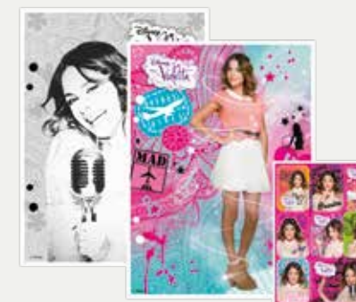
ZESTAW: WKŁADY, KOLOROWANKI, NALEPKI (ZWKNVIBJ)